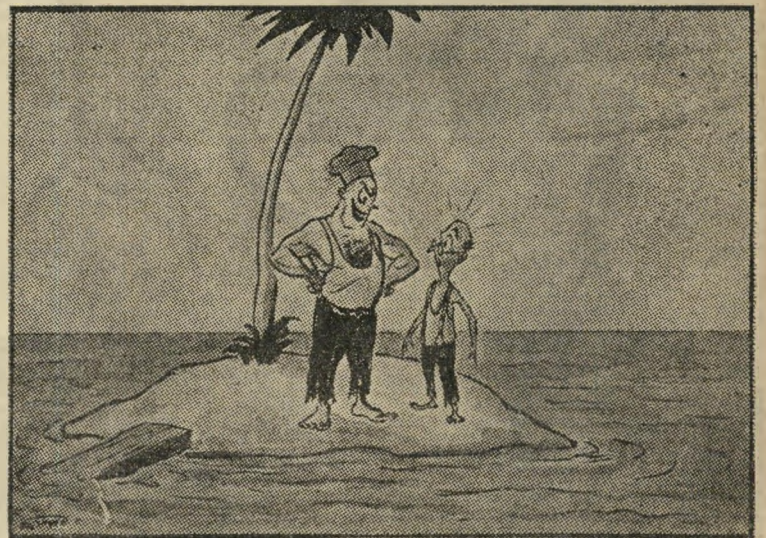
„ובכן, אתה זה הנוסע מתא 23 שהתלונן על הבישול?“ פריץ מאוריבר, בספר, חיובו של נפסון, חיפה