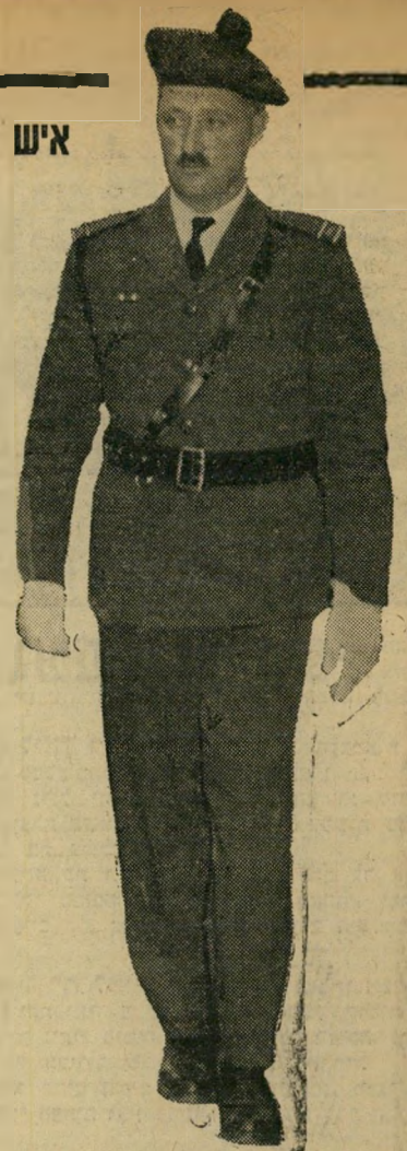
חצור (במדי קצין הכנסת)