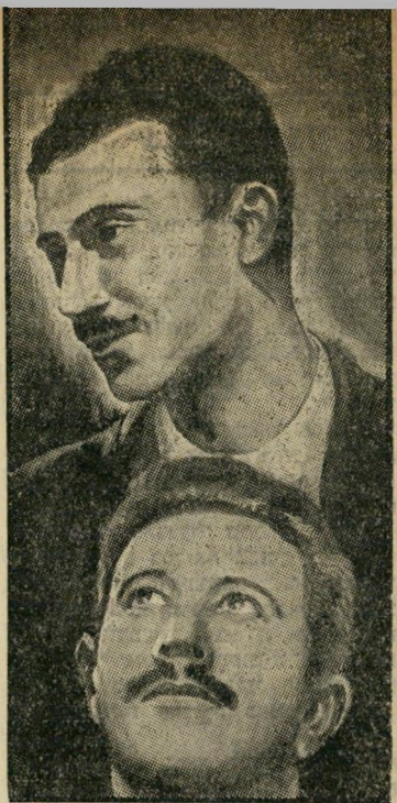
חכים (למעשה) ובית צורי התלפין רעד

• עד כדי כך שראש-ממשלת בריסניה דאז נקט שיטה בלתי-רגילה, הביע פומבית, פרלמנט הבריטי, את "התקווה" פסק"הדין של בית-המשפט המצרי יבועע.