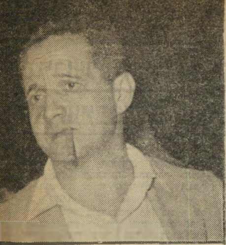
גמזו בני אש

ה' יזקוי דעות אחרים היו בין קניוק לקורטוריון בקשר לבנייני המוזיאון. הוא התנגד לתכנית בנין הלנה רובינשטיין, הקורטוריון אישר אותה. התוצאה: אילמי תערוכות, הנראים מבחוץ כמוסף ענק ואינם