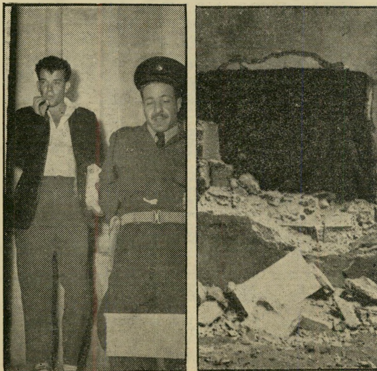
מכונת-תופת הב"קיעה את קיר דפוס ישראל בשעת הדפסת העתון, פצצה פועל.