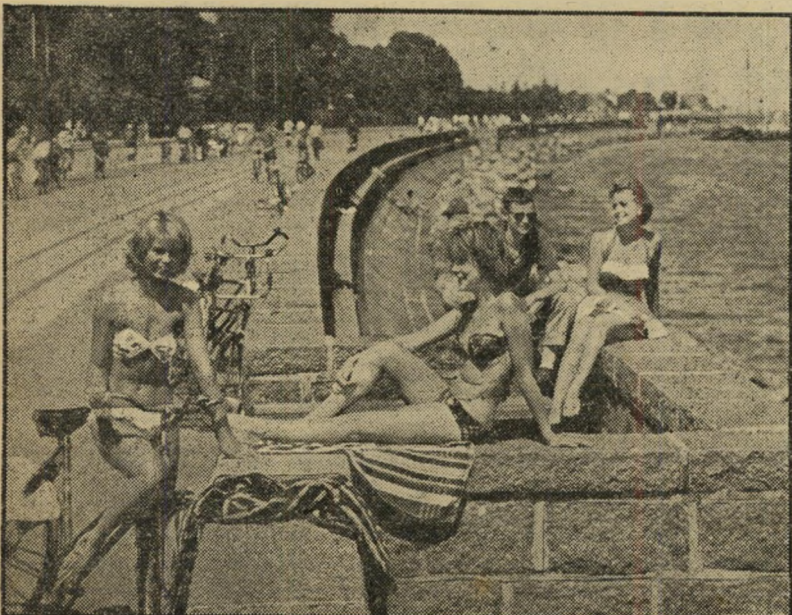
חופשה של ממש מתאפשרת בחופים המטופחים של הצפון

האם לא ידעת כי סקנדינביה היא מרכז אופנה חשוב? בשטח אחד, פרוות, היא הראשונה בעולם. ובכלל — הקווים הסקנדינביים החדשים הפכו לשם דבר. עבודות החרסינה וה"צורפות הדאנית והנורבגית זכו לשם עולם. האיכות הגבוהה ברהיטים, דב-ריי-כסף, קרמיקה ואריגים מבוססת על אומנות ומסורת דורות. האם יש עוד מקום בעולם היכול להציע כל כך