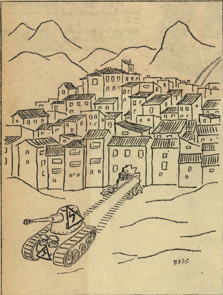
"אמרתי לך שזו לא בעיה לנהוג במנקה!"