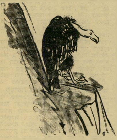
הנשר הכודק את רעש הבולדוזרים

בחשבון. מספר האפשרויות לתמורה מתאי מה לכספו של המפעל המממן הוא כמעט בלתי-מוגבל, כיוון שמספר הנושאים הוא גדול. מי שלא ירצה לתמוך במפעל הנשרים יוכל לתמוך במפעל הצבאים (20 אלף לירות), או במפעל היעלים (16 אלף לירות), או בשימור פרחיבר מסויים (20 אלף לירות).