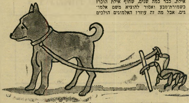
הסרטן העיוור מטבחה מטייל עם מקל לבן וכלב מדריך