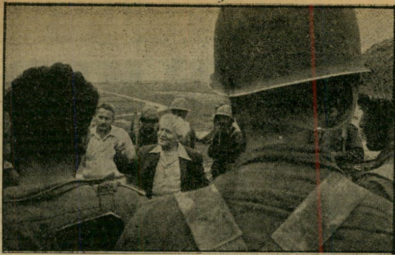
דויד בן-גוריון עם לוחמי נוקייב מי החליט?