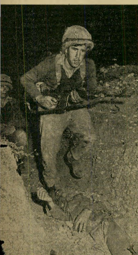
בתוך שוחה כמוצב נוקייב מי מנסה לנצל?

חציאי בדרום-מערב בריטניה; (55) הסתיים; (57) שומר נדודי; (58) דורון; (59) קיבוץ ב' קירבת מנדל-אשקלון; (60) כנללה פרצה מל- חמת טרויה. מ א ו נ ג (1) מחבר האורטוריה "אסתר"; (2) ממכות מצרים; (3) ערב-רב; (5) מאתיים ועשר; (6) תואר צבאי; (7) מספיק; (8) מסריסי המלך בשושן; (9) מכתיר אסתר למלכה; (12) אביון; (16) שולי הכנר; (18) גהרד; (18) בני שלוש שאות והפיישים.