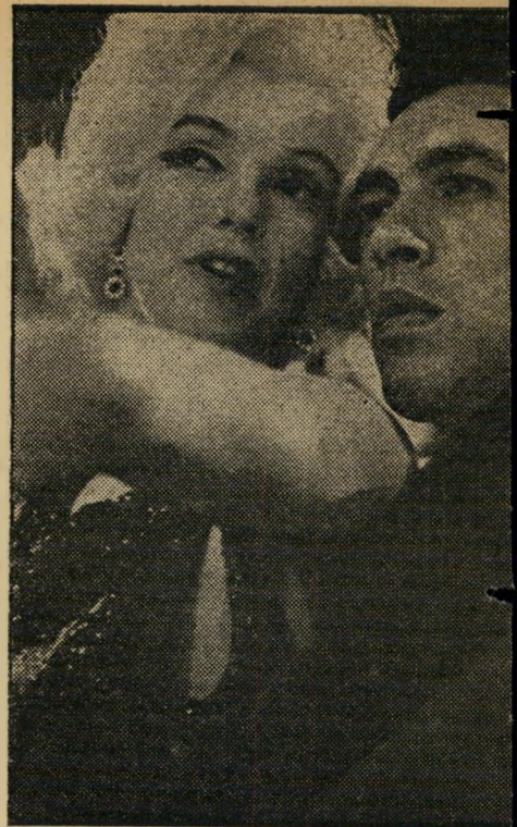
מאריקין ובלאנו תחזית לחווה

אמריקה. אני אורו את חפצי ובא ארצה. הכינו לי באנקט ראוי לפרסקיו" . . . מלאי רוגז ותמיהה על הרבנות הראשית היו יורשי הרב אייזיק הלוי הרצוג, על שלא טרחה לקבל את רשותם להדפסת מאמריו בשאלת ענת בני-ישראל. היורשים, המתכננים להוציא בעצמם את כתבי הרב, רצו לתבוע את הרבנות לדין, שלחו לה הודעה על כך, לא זכו למענה. השבוע התבררה להם הסיבה: מאתר שהבחירות לרבנות עדיין לא התקיימו, טוענים יועצי המוסד שאין שום גוף שאפשר לתבוע לדין.