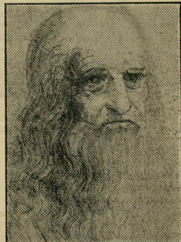
ליאונרדו דה וינצ'י אמא דוחה

במצב אחר, אם האם היא פרובוקטיבית ומספקת, כלומר נכנסת למשחקי אהבה בלתי מודעים עם הילד, מתפתחת הומו'סקסואליות פעילה וגברית. לא תמיד זו עוזבת להיות האם. במקרים רבים זו יכולה להיות גם אימנת. במקרה