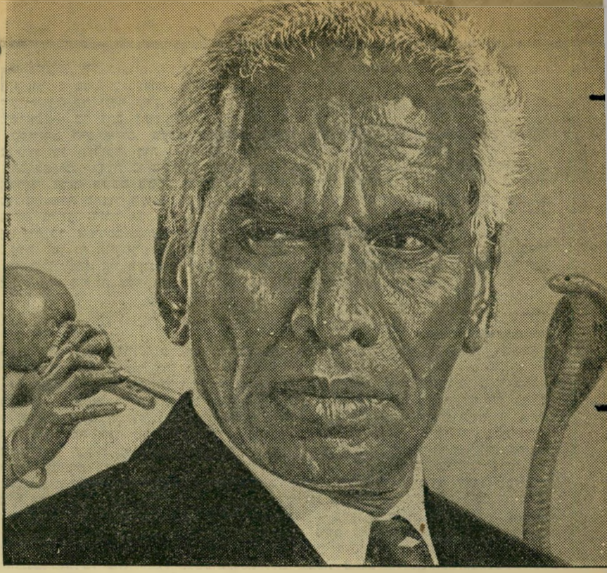
מנה של מונן כך הופיע קרישנה מונן - שד הבטחון של הודו, עוזרו הקרוב של נהרו ומנהיג הגוש האפרו-אסייתי באו"ם - על שער השבועון האמריקאי טיים. השבוע היה מונן מועמד מפלגתו באחד משכונות בומביי.

א יני יכול לסיים את סיפור מגדלי הדממה בנימה כה מדכאה. אך יצאנו