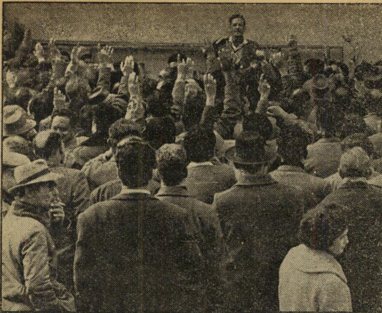
הצבעת-יאמון בועד הפעולה בחצר מרכז הדואר הזמנות לנשואין, תזכורות מסי-הכנסה —