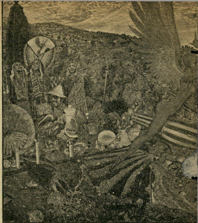
אמנות). תמונה סוריאליסטית זו של קלווין הובן צוירה במאי יורקה, בעזרת שתי דוגמניות-עירום — האחת לבנה, השנייה שחורה. אם העירום מותר לפרסום בציור, מה פסול בו בצילום?

★ ★ ★ טשרניחובסקי והמקלחת בישראל נוצר מצב מוזר במיוחד. אין לשכוח כי כל התנועה הציונית