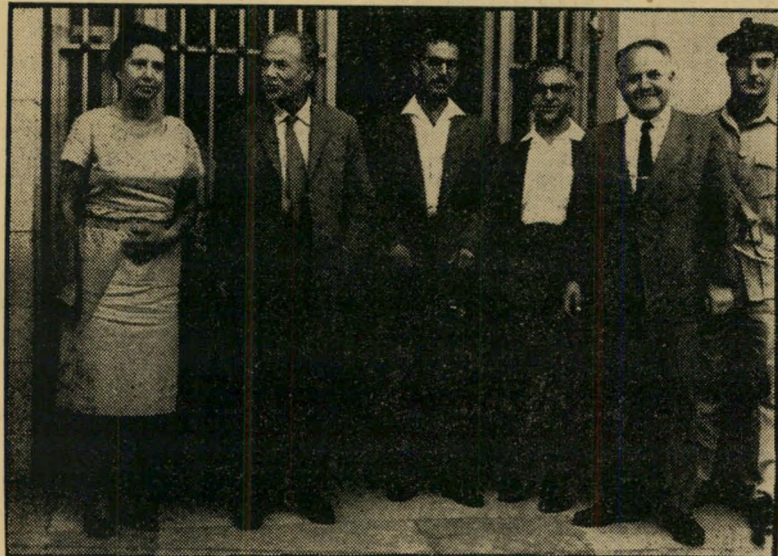
פיעת מק"י בכנסת* קשר השתיקה

הטרוניסטור המבוקש ביותר ביפן מיוצג בישראל ע"י אלקטרוניקה בע"מ ת"א פינסקר 2