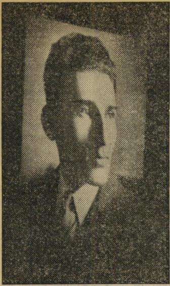
יאיר עז הקיר מה אמרו אז