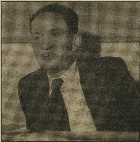
בורסאי הרצברג העסקים הלכו חלק