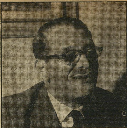
בנקאי רורין המשק בנוי לפיחות

האבסורד הגדול ביותר נוצר במכס. מתברר שיבואנים שקיבלו מחוץ-לארץ סרטים וכבר שלמו בשבילם, אבל משום מה השאירו אותם עדיין במחסני המכס, יצטרכו כעת להוסיף חצי לירה לכל דולר שכבר שלמו. אחת לא נותנים להוציא את הסרט מהמכס. מילא, אני מבין אם יעשו סידור כזה לגבי חמרי-גלם, שעליהם הפחיתו את המכס. אבל על סרטים לא הפחיתו ומבקשים גם תוספת על אלה שנשארו במחסנים מלפני הורדת השערים. אין ספק שהדבר ישפיע על הענף, אלא שעדיין לא ברור אם זה יתבטא בצמצום היבוא או בהעלאות מחירי הכרטיסים.