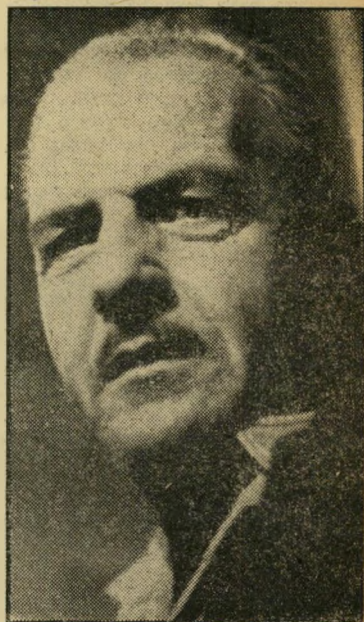
נהג חליץ השוטרים צחקו

(המחן ממעוד 20) רנאטה שמיט, מהעיר ופרטאל: "פיר יה וילהלם שניידר" • אינגרד בר, מהעיר פלנסבורג: "...אנכי, היהודים נמנים עם הבעלים ה' טובים ביותר בעולם!" פאול היידנל, מהעיר אייטורף: "מדוע לא סיפרתם כי האיש הזה כבר התגרש פעמיים, וכי קצין בחיל-האוויר הבריטי השתתף במלחמה האחרונה בהשמדת ערים גרמניות? האב צודק בהחלט כשהוא מבקש למנוע בעד בתו להינשא לגבר זה, שהוא גם מבוגר ממנה ב-17 שנה. אין לזה שום קשר עם היותו יהודי." • יוזף האן, מהעיר מלפלד-הארבורג: "עורכי השטרן יכולים להשיא את בנותינו לכושימ, וכו'. אנחנו לא שואלים אותם למי להשיא את בנותינו ולמי לא." • ואלטראוט ואלנר, מהעיר קלן: "מי שעדיין לא נפקחו עיניו לגבי התעלולים הניאורפאטיים בגרמניה המערבית, אפי' שר רק לרחם עליו." אך כל זה היה כאין כאפס לעומת המכתב שהופיע בראש המדור, ושנכתב בידי ישראלי הנמצא בכריכל. וזה לשונו: "כחברו-לדת של מר ואנר, אני מגנה בחריפות את גישתו ועמדתו. הוא חזר למור' לדתו הקודמת, כשבלבו האשלייה כאילו חל שינוי ביחס הגרמנים ליהודים. מדוע