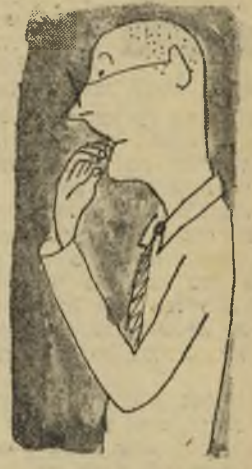
היכן לפי הרחוקות שמתו את השניים התותבות שלי!

בהשפעת שבוועון מסיים אחד נשתרשה בציבור הידועה, שאולי אין המשיך רה אלא אוסף של פקידים, אשר חלק מהם מזויין ב- אקדח ומקל וחלק אחר ב- גיירות וטפסים, וכולם ב- יחד אוכלים ארוחת-צהרים על חשבון משלם המסיים, שאת ההפגנות שלו הם מפזרים בזריזות.