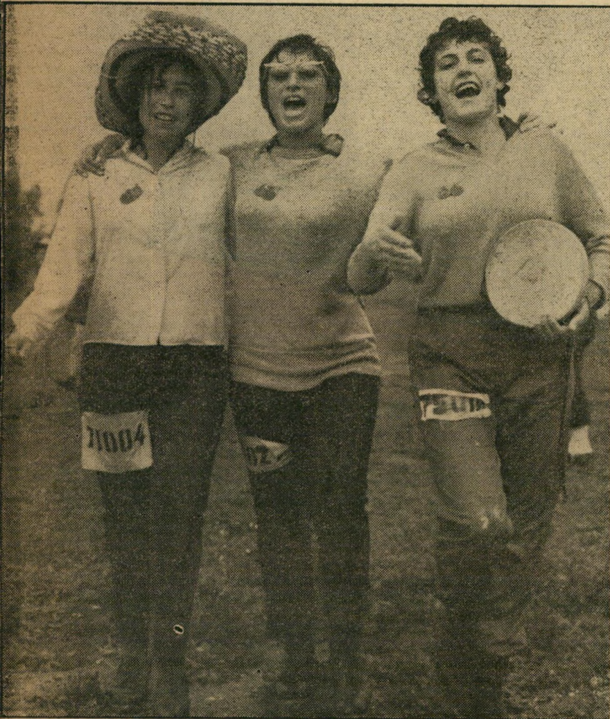
צבריות בצעדה ... בחמת זעם בתולית

הן יודעות היטב כיצד להלך — כאשר הן רוצות להריץ אחריהן את הגבר. הן יודעות אף מתי לעמוד מלכת — כשאין בכוחן להמשיך לרוץ. מכאן — משמע, שאף לחוש היטב הן יודעות. הן יודעות היטב כיצד לשבת ולעמוד. הן יודעות