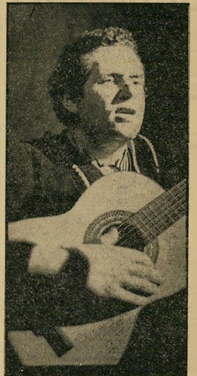
מדחין-זמר שומן הכסף הוא בולשיטו!

לא היתה זו שירה של זמר בעל גרון מפותח ומאומן. הקול היה צרוד ולחשני