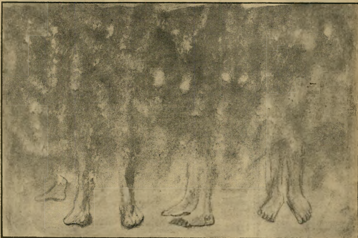
בחדר האדים הלוהטים: 4 נפשות מחפשות בעינים עצומות את כרו המים הקרים

הימים חולפים, החתולים אינם כבר, אבל הטלפון עוד ממשיך לצלצל. טוב ושוב נזכר מישהו שחסר לו חתול סיאמי בבית. משפחת גת ראתה שאין ברירה והתחילה