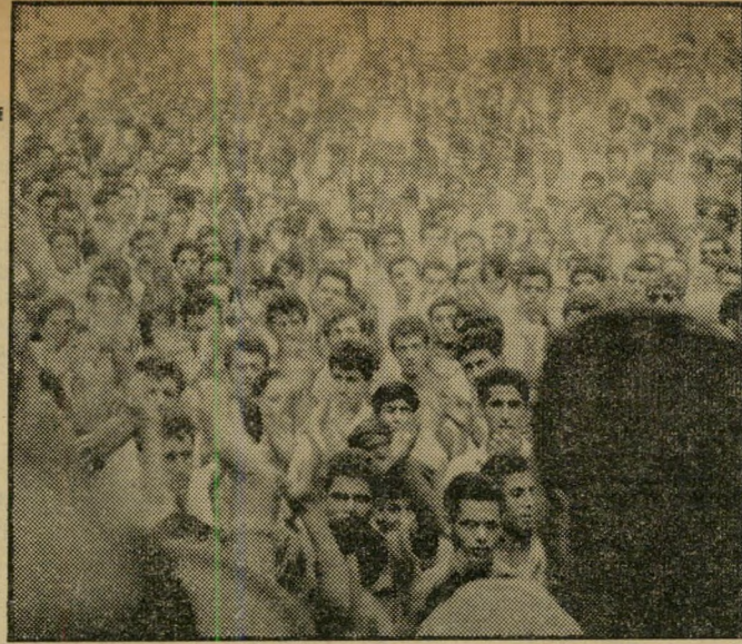
יתרון 2 מניעת התארגנות של הערבים בגוף פוליטי עצמאי. לולא המימשל הצבאי היו המונים אלה מקימים מפלגה שלהם, שהיתה לוחמת בכנסת למען המיעוט הערבי.

וזה רק גזק „טכני“ מצומצם. קיים הנזק החמור העיקרי: נוכחות המימשל, והאפליה הכרוכה בו, יוצרת את קרקע השינאה, שהיא הפוריה ביותר להצמחת מרגלים ותכלנים. במשרד יועץ ראש הממשלה לעניינים