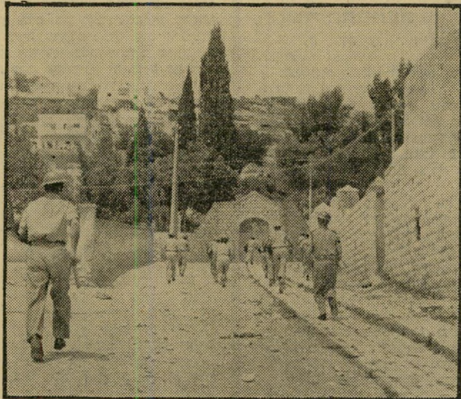
יתרון 4 הפגנת יחוס מתמדת. בתמונה: כיתת שוטרים חבושי יקסדות מסתערת על אחת מטימטאות נצרת, לפיזור קהל מפגינים שלא קיבל רשיון מהמימשל להפגין.