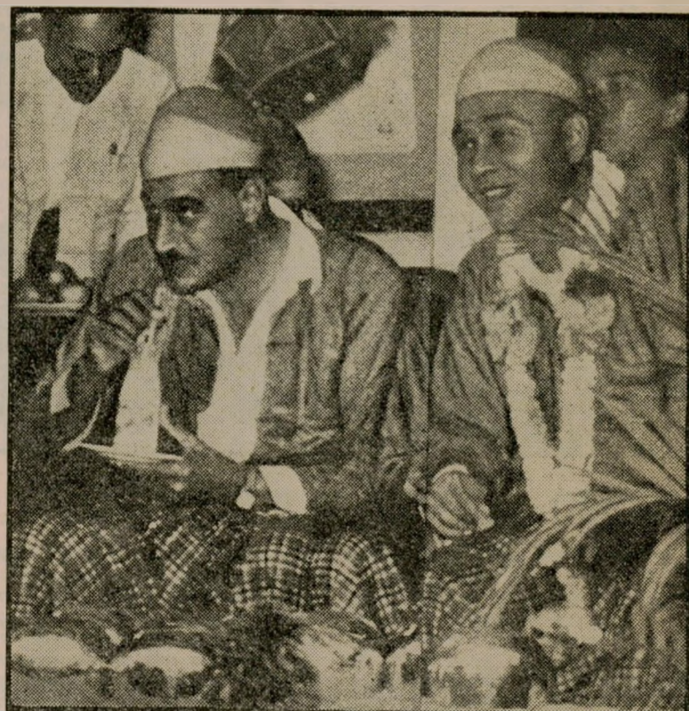
ארנו עם בן-גוריון