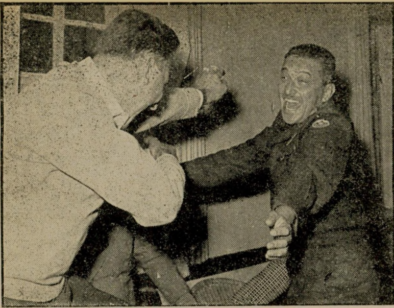
עזר ויצמן מקדם פני קורי גם ליפול צריך לדעת

עלמה רצח! אמרו ביום השלישי האחרון בפאריס — והאלות פצחו באשים. היה רצח — אך היה גם משהו אחר. היתה התגלות של כוח המוני, שהטביע את חותמו על צרפת. אין זה הרבה — אך אין זה גם מעט. והקרב ניכס לא על צרפת בלבד.