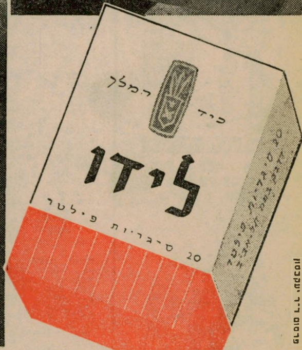
פריסום ר.ר. יעקובסון