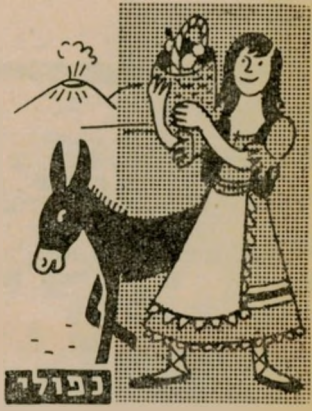
10.1... כנאפולי כיום — עם טיול לפומפיי

מוזר שז' כלב: בנתניה, רדפה עדת כלבים בועם אחרי רוכב אופנוע, הבהילה את הרוכב, שטטה מהכביש ונחבל בראשו כאשר התהפך אל תוך תעלה. . . . ספר הספרים: בתלאביב, כאשר מיינה מחלקת הנוער של העירייה את הספרים שנאספו במכצע 199 לפרברים, גילתה בין המבחר הגדול של התרומות גם כמה עש' רות ספרי טלפונים משנים קודמות. . . . ימות המשיח: בבתי-התלוננה ה' הברה קדישא בפני העירייה על חוסר מקום מתאים לקבורת מתי העיר, הודיעה שאם לא יתקן המצב היא "תנקוט אמצעים נגד הנפטרים. . . . שעת הכישר: בחיפה, הובאו לפני בית המשפט כעשרים נערים, תלמידי מוסד רמת-הדסה, שנאשמו בכך שניצלו את המהומה שנוצרה במקום בעת הפגנת החרדים לפני כמה חדשים, גנבו חפצים וחילבו ברכוש המוסד.