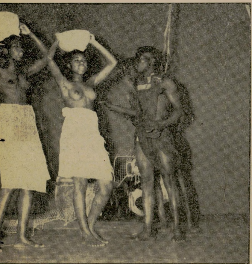
קטע מאחול באגים סנגאלי - כך הופיעו רקדני הלהקה

קפיצת מחול של רקדן מבני שבט אולוף של סנגאל, אחד הקטעים המרשימים ביותר שבהופעת הלהקה הסנגאלית. כל אנשי הלהקה, כמו מרביתם של תושבי סנגאל, הם מוסלמיים לפי דתם.