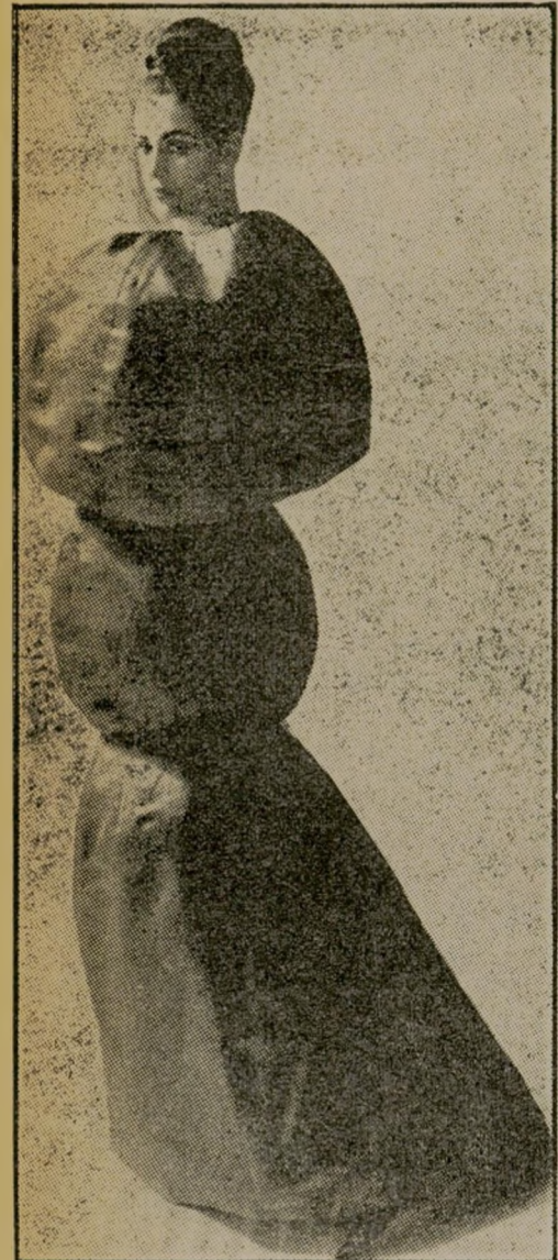
אפנת העקרב 1962