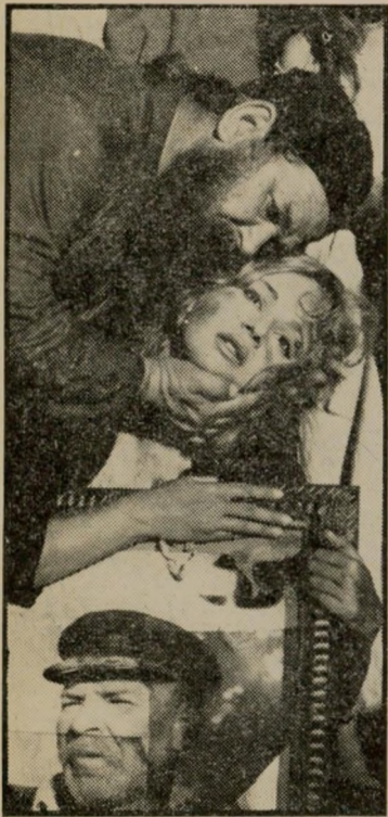
אליקי ב"מודלנה" היווניה מעניינת יותר

כמו התולת בר. שני הסיפורים דוריים ושניהם מיעלים על הבדד בקומדיות. ההבדל הוא רק שבאהד (היווני) צוחקים ובורים ואילו בשני (ההולנדי) משתעממים. כי זה אילי הכוד שהולנדי לא הצליחה לתפוס עד עכשיו — מידת הביזור אינה