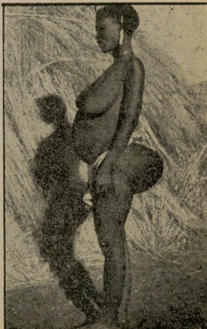
הוטנטוטית חולצת משכית וסט"ס