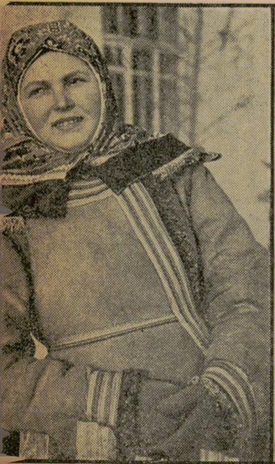
צברית רוסית בכביש, במיפעל ובקלנה