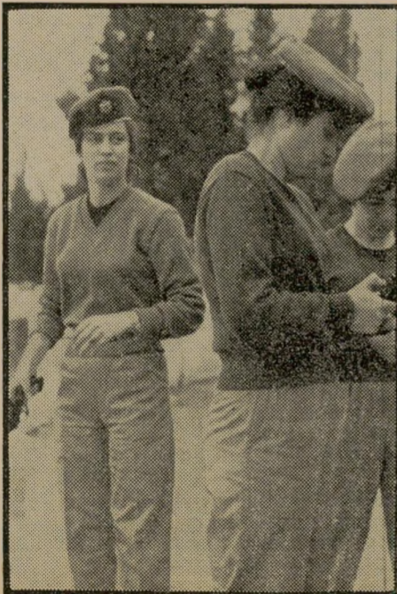
שוטרת ישראלית טבעיות ואורייגניות...

מחוסר מסגרת מקומית חיפש לו דפוסיים זרים, שיהיו מכה-משותף בינו לבין קיבוץ הגליות. במקרה, או שלא במקרה, בחר הנוער העברי בדפוס התנהגות של אירו. פה המערבית, או אפילו של ארצות-הברית. כאן התנגש האופי הצברי כמות שהיה, בהתנהגות ובמוסכמות שונות משלו. התו" צאה - אבדן טבעיות וחוסר חן.