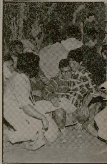
באכזיב יותר מאשר על-ידי מאמצי שתי הממשלות שנים. הישראלים טבלו באחירה הצרפתית. נהנו מן וג לתרום, לדברי הנהלת המועדון, את חלקם בהגוי

לא פעם נתקלו בשוטרים ובשמורים, שהוצבו במספרים מוגברים מסביב למוע- דון. כאשר הצליחו לחדור מבצע לטבעת הבידור, ניסו להתלבש על צרפתיות — התנהגות שהרגיזה את כל באי המועדון והפריעה את האחירה במקום.