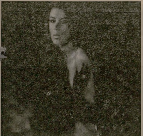
הוכעת סטרפיטיו במתכונת מקובלת.