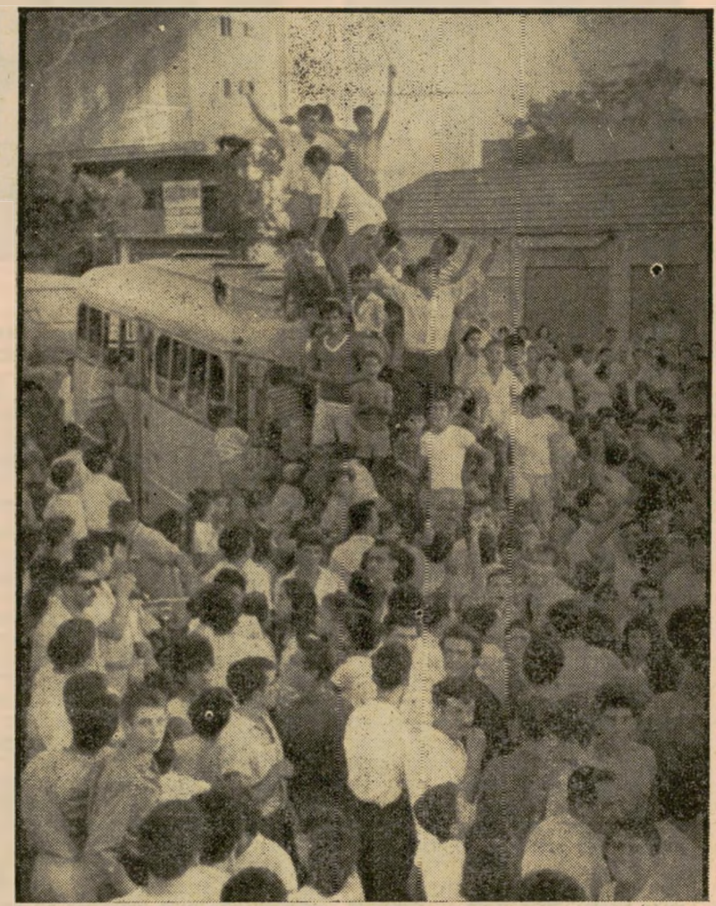
תחילת ההפגנה — המפגינים מספטים על אוטו-בוס, משמיעים מעליו קריאות נגד העירייה. באותה הזדמנות נקמו בחברת דן, על שירות האוטובוסים הלקוי שלה אל השכונה.

סמוך לשעות הצהריים התנהל על שביל העפר טנדר ירוק, בו ישבו כ- ארבעה-עשר עובדי עירייה, מצויידים בכלי הריסה. בעיקבותיהם, כנהוג במבצעים מסוג זה, נע כוח משטרה. הוא מנה, הפעם, שוטר רוכב ושוטר רגלי.