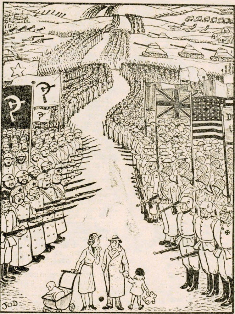
„האם אתה בטוח, יקר, שזה ימנע את השואה האטומית?“