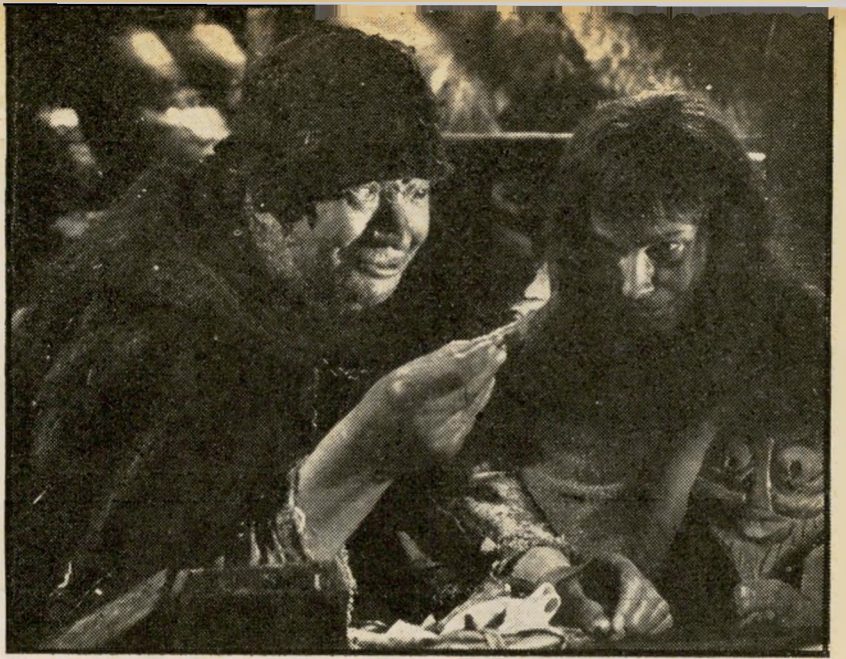
1. מעיין הבתולין ותותי בר (שבדיה)