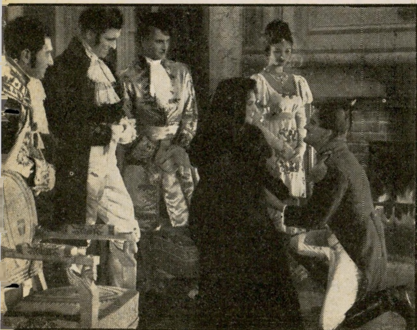
2. אוסטרליץ (צרפת)