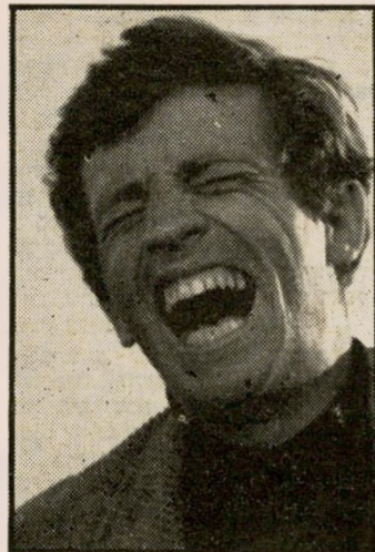
שחקן השנה ז'אן פול בלמונדו עד כמות הנשימה

אף על פי כן, מתחת לפני השטח התרחש משהו. למעשה עמדה השנה כסימן התעוררות, אפילו מהירה מדי, של הסרט הישראלי. שלושה סרטים ישראליים הוצגו לעיני הקהל. שניים מהם (הם היו עשרה ואי