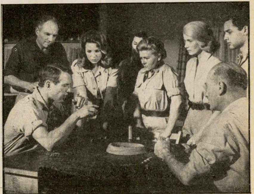
1. אקסודוס (ארצות הברית)