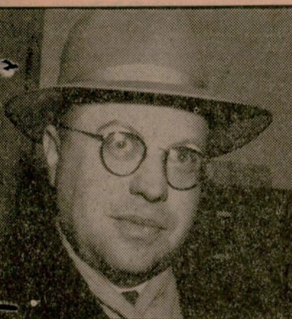
יוסף בורג שר הדתות