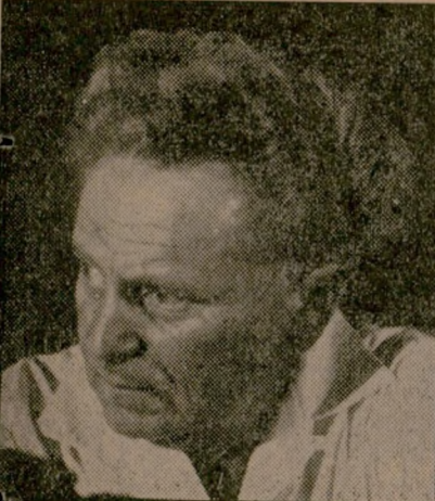
ישראל גלילי שר הבטחון

ותקום ממשלה חדשה בלי השתתפות דויד בן-גוריון. מבחינה זו אין הבדל רב בין שתי ההצעות.