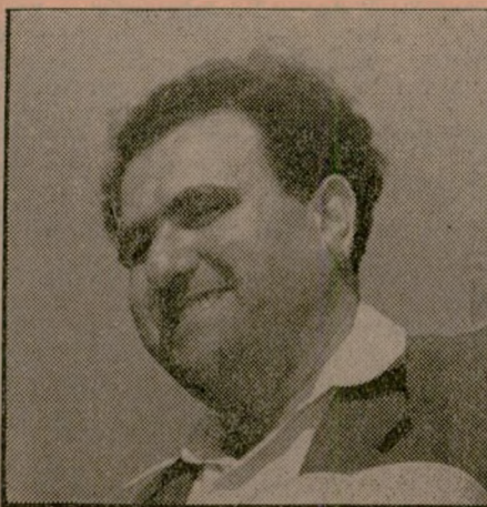
ישראל ברזילי שר החקלאות