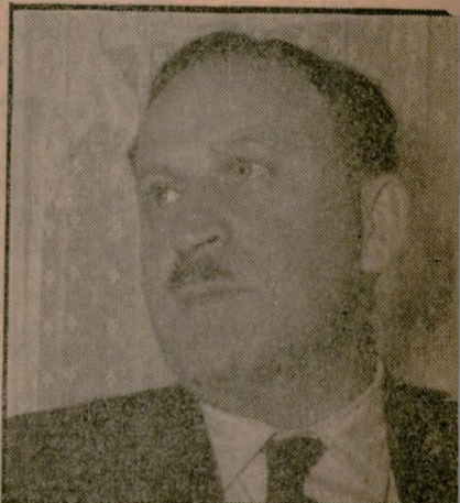
יעקב מרדור שר התחבורה

אם יפר התחייבות זו — פשוט תחליט הממשלה ברוביקולות להתפטר.