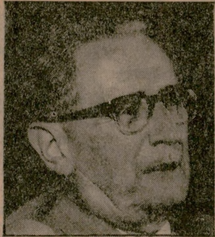
נחום גולדמן שר החוץ