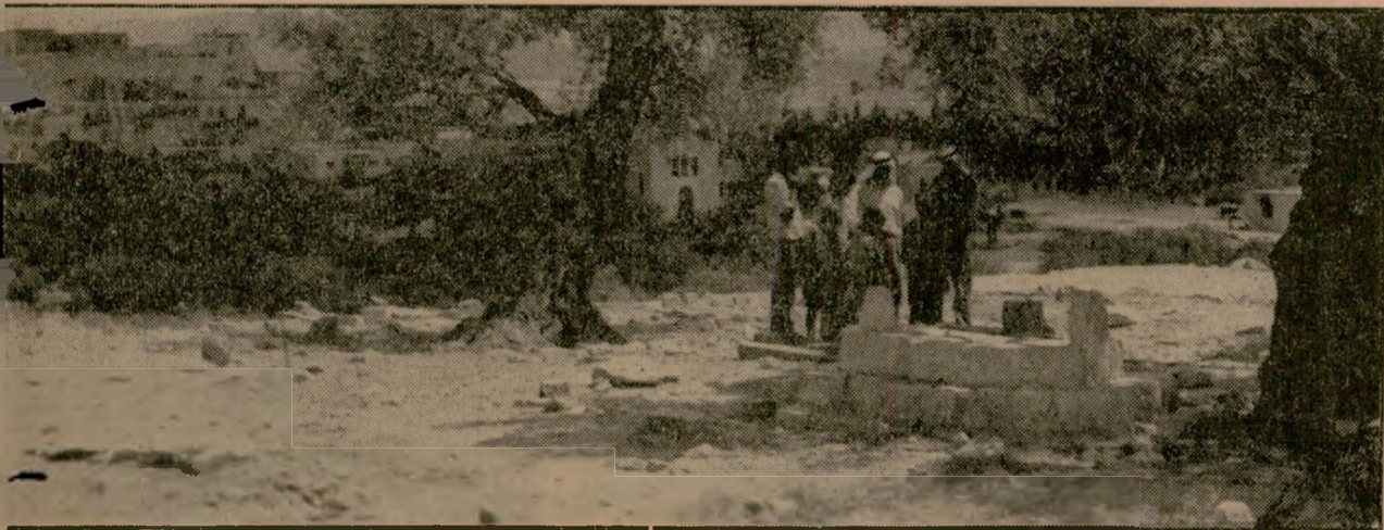
סאלח היה בן 25 במוותו, השאיר אחריו אלמנה וארבעה ילדים קטנים. מצד ימין של התמונה, בקצה שדה הקבורה של כפר אל-אסד, נראה הבית הראשון של הכפר, שותף המריבה, בענה.

ת ושבי שני הכפרים חשו כנראה מה עלול להתרחש, עקב תאונה קט-לנית זו. על כן פנו זקני דיר אל-אסד ו-בענה, בנפרד, אל משטרת עכו, בבקשה ל-הציב כוח משטרה בין שני הכפרים, בעת