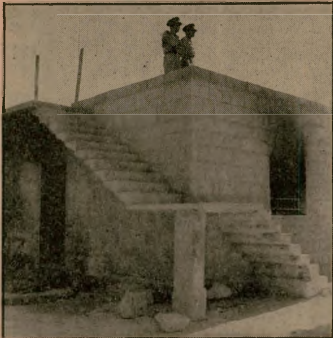
שני שוטרים עומדים על גג ביתו של נהג האוטובוס, אחרי שנפרץ והועלה באש. בית זה, שהוא הקרוב ביותר לדיר אל-אסד, היה הראשון שהוצת.

בימי המנדט פרץ בין שני הכפרים ריב דמים. אחד מבני בענה נרצח, ומשפחתו האשימה ברצח אחד ממשפחת אל-דבאח מ-דיר אל-אסד. בית-המשפט לא מצא שום הוכחות. אנשי בענה המתנינו כימעט שני תינים, לנקום את נקמת הדם. בוקר אחד נמצאו שניים מבני משפחת אל-דבאח הרוריים, באוהל שבו שמרו מטעם מחלקת ה-עבודות הציבוריות. שוב לא יכלו המשטרה ובית-המשפט למצוא שום הוכחה, וכולם