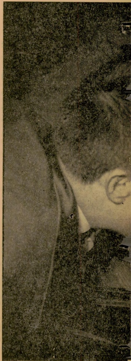
משיכה לכל כוכבי אירופה מהווה, למעשה, מרכז כב מארבעה אולמות נפרדים. "הפרינציפ שלי" יעשה מה שהוא רוצה — רק שלא יפריע לאחריט."

"שמעתי על מסעדה מחורבתת ברחוב הי' ראשי של ברלין, שהחליפה בעלים 16 פעם לפחות. ניגשתי אל בעל המסעדה האחרון, שעמד בפני פשיטת-רגל, והצעתי לו שיש' כיר לי את העסק, הגרמני הסכים וכך הפכתי למנהל המקום."