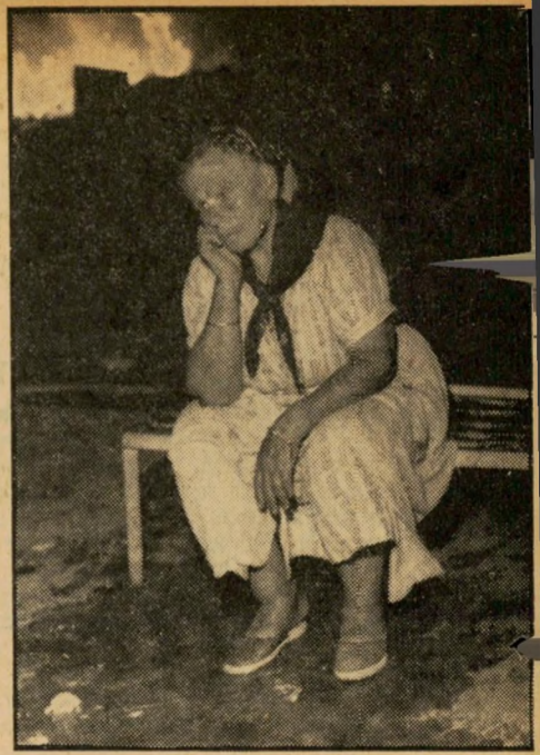
צריכה נהרס לאיתור שריפה