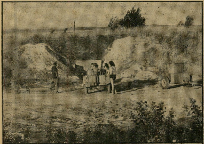
לאנשי המקום משמשת הסוללה על מנת להגן עליהם מפני צליפות אפשריות הממוצבים הסוריים. הסוללה יעילה גם כמקום טיפוס וגלישה לילדי המקום. ביום רגיל יש נדמה כי אוירת המתיחות לא מגיעה כלל אל אנשי המשק.