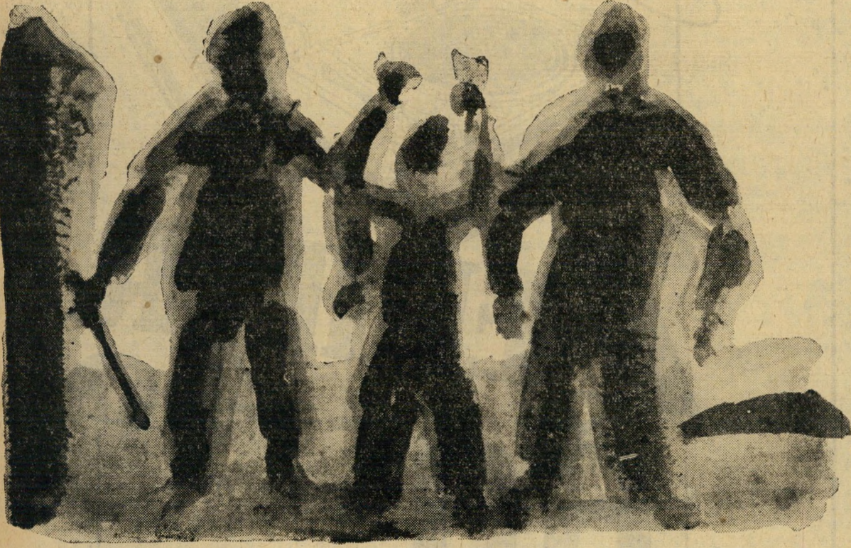
שלושת יצרני-הבלוקים שהתנפלו עלי כפי שנראו לעיני התרופות אחרי שנשברו לי המשקפיים

בייצור בלוקים בקבלנות, כשהם מקבלים ארבעה גרוש ושמונה מיל בעד כל בלוק. כמו שאתם יכולים כבר לתאר לעצמכם, מתחילים את העבודה בשלוש בבוקר. עושים תערוכת מלט ודופקי סאת הבלוקים, ואחרי כן מסדרים את הבלוקים שורות-שורות ו- קומות-קומות, עד שעה חמש בערב. עובדים 12 עד 14 שעות ביום ועושים, בערך, 250 בלוקים, לפי ארבעה גרוש ושמונה מיל החתיכה, שזה כ-300 לירות לחודש. אחרי שגומרים את העבודה בחמש, מתר-