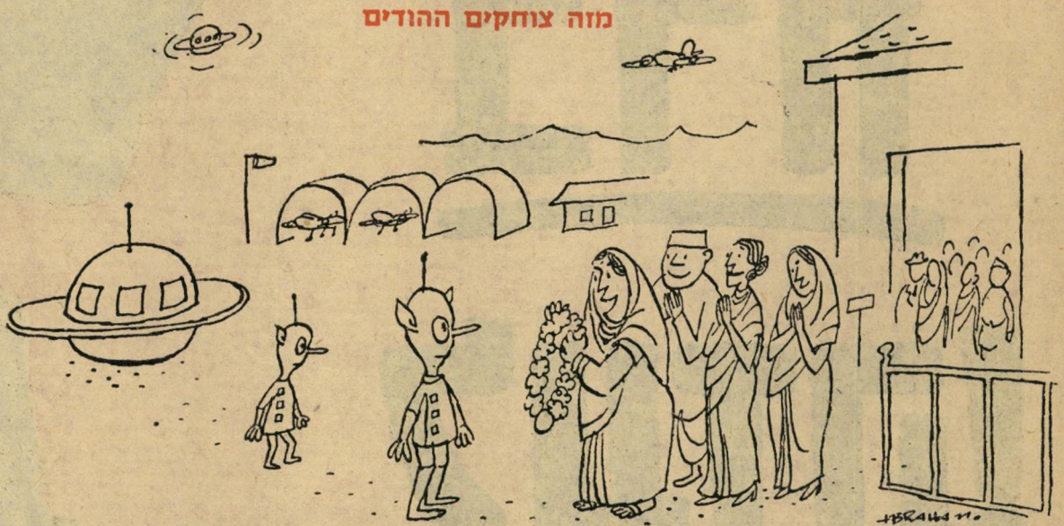
"אנו מחכים אומנם למשלחת מאיסלנד, אך נשמח לקבל בברכה כל אורח..."