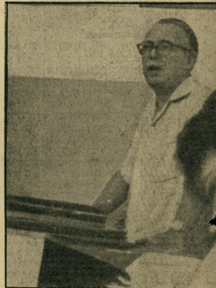
מעיד במשפטו ההשמעות נעלמו