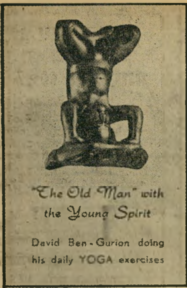
על הראש או חומר היתולי