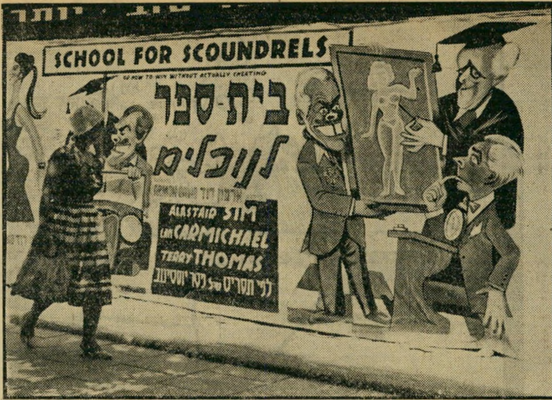
על מודעת קולנוע סמל מסחרי