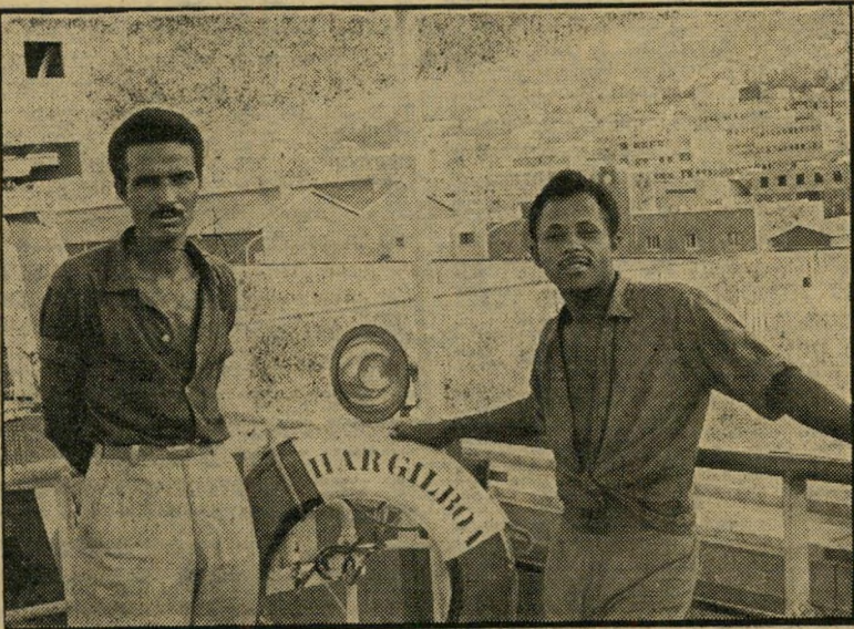
פלוטי אנגולה על סיפון "הר גלבוט" בחיפה הגופה נזרקה לבאר

ביקורו של דויד בן-גוריון בפאריס, בעת שהמשא-ומתן באוויאן הגיע למשבר זמני, הייתה סיוע ישיר למאבקה של צרפת, היה בו כדי לרמוז לערבים: עוד יש לצרפת בנות-ברית, היכולות להתקיף את הערבים בעורף, בעודם עסוקים עם צרפת בחזית. זאת הייתה משמעות המילים החמות של דהגול, שהגדיר את ישראל כ"ידידה ובת-"