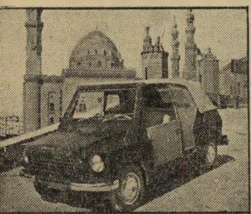
מכונית עממית מצרית