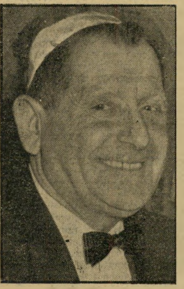
דא-ציוני רוניק אחד בדורו של האחד בדורו

עם תום שירותו, עלה לארצות-הברית. שם החל עוסק בענייני אמרגנות ושעשועים, הקים כמה מגני-השעשועים והלוונה-פארקים הגדולים של אמריקה. תוך כדאיך התעשר, הפך למיליונר, הקים לעצמו חחילת-סירה מפוארת באסבורי פארקס האריסטוקראטית (המשך בעמוד 22)