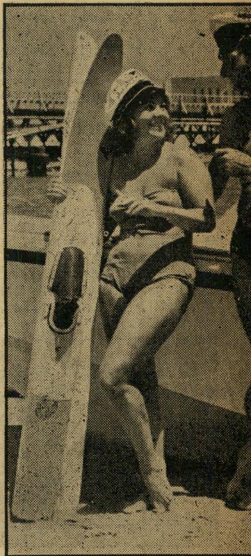
יקרבים לו זפימה מזראו