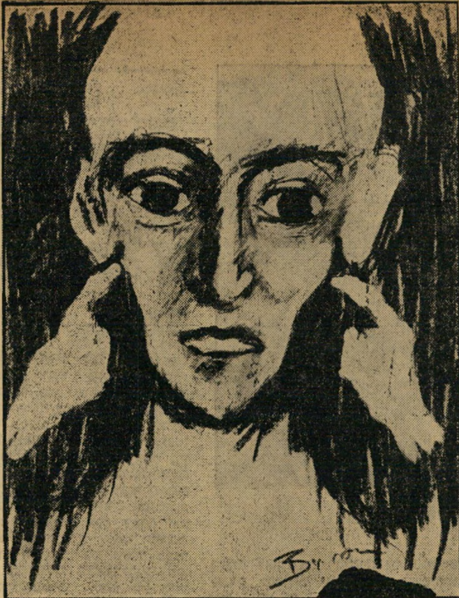
המוסלמי — יושבי המחנות קראו לגוועים ברעב בשם "מוסלמי" מאן — מוסלמי בעברית. הכינוי בא מהעובדה שהגוועים סבלו מקור, עטפו עצמם בשמיכות, השישו להם מראה ערבי.

יחד עם 60 ילדים אחרים, בני 12 עד 16, נשלח באקון לעבודה בעגלות-האשפה של המחנה. במקום סוסים, גרמנו לכל עגלה 20 ילדים. כך הגיעו לכל פינה במחנה, כולל מחנה-הנשים. הם דאגו לנקיון בתאי-הגאוזים,