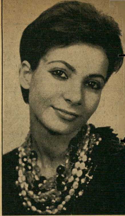
זמרת רייכשטאט הצלחה רפה

את התשובות בצירוף החידון יש לשלוח עד יום 29.5.61 — לפרסום צימט, ת.ד. 4100, תל-אביב, עבור "חידון הברות ע".